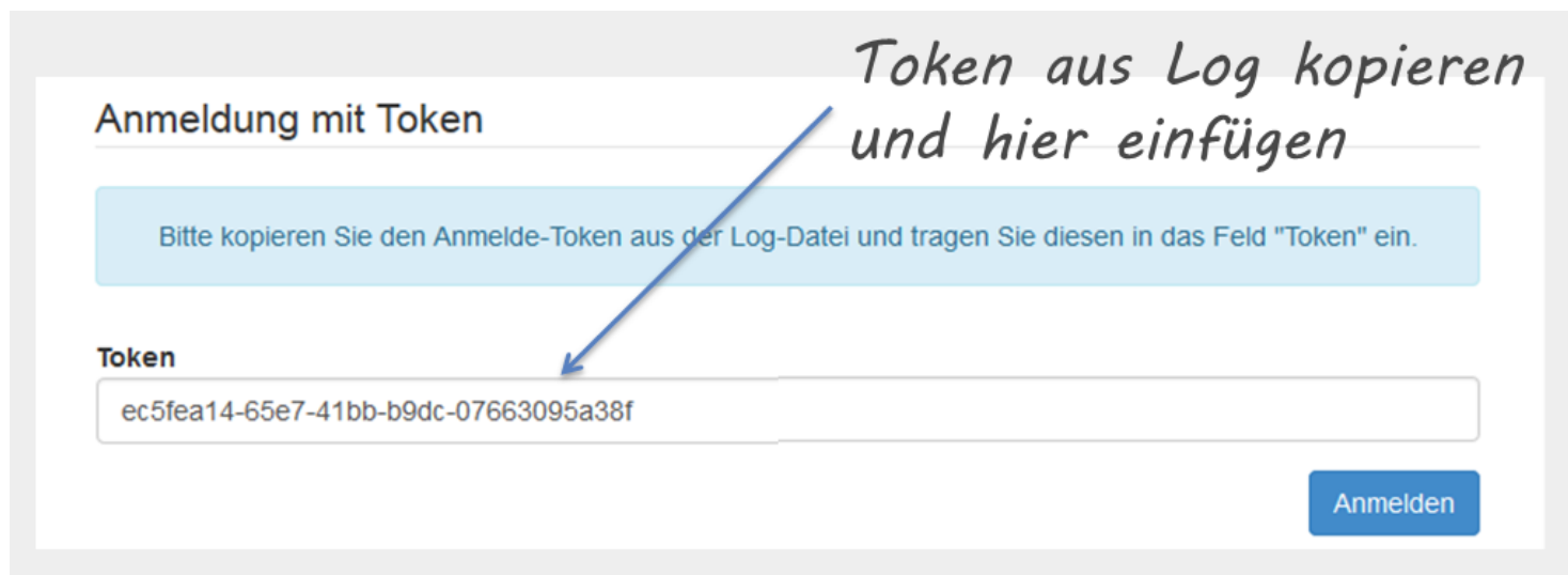
Abbildung 1: MIR-Wizard - Sicherheitsabfrage nach einem Token

Nach Aufruf dieser URL wird der MIR-Wizard gestartet, der wie Abb. 1 zeigt, ein Sicherheits-Token abfragt, das sich im Log des Servletcontainers (z.B. Tomcat-Log, siehe Abb. 2) befindet. Sucht man im Log nach "Login token", findet man die entsprechende Stelle recht schnell. Das Token - eine UUID - muss dann vollständig kopiert und eingefügt werden. Danach kann die Installation beginnen.